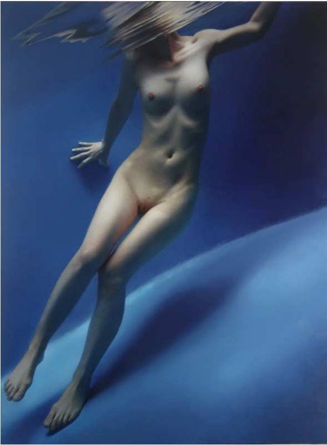
Jan Mikulka, “In the park”, oil on canvas, 100x70cm 2015

presente, in particolare alla produzione degli artisti cechi negli ultimi 25 anni, dopo la caduta del regime comunista e la fine delle costrizioni alla libertà di espressione.