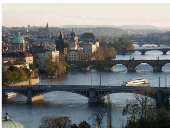
Vista del ponte Carlo

L'interscambio tra l'Italia e la Repubblica Ceca è cresciuto lo scorso anno del 5,7% ed ha raggiunto la cifra record di 12,5 miliardi di euro.